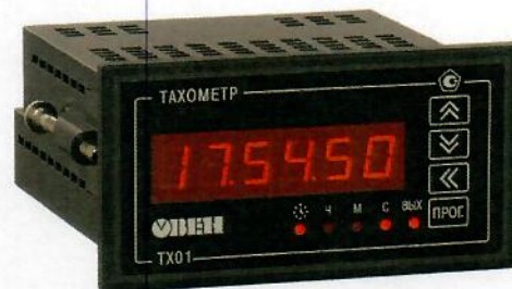
Рисунок 3 - Общий вид счетчиков в корпусе для щитового (Щ2) крепления

Пломбирование счетчиков не предусмотрено.