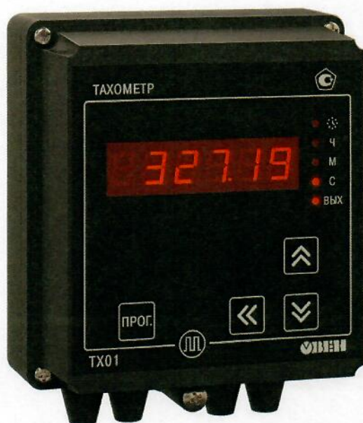
Рисунок 2 - Общий вид счетчиков в корпусе для настенного (Н) крепления